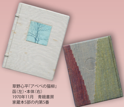
草野心平『アベの猫柳』 函(左)・本体(右) 1970年11月 青娥書房 家蔵本5部の内第5番

本展では平成23年度以降に収蔵した資料を中心に、草野心平の自筆原稿や戦前・戦中の掲載誌、書籍、草野心平研究者として知られる故・深澤忠孝（ふかさわちゅうこう）氏の研究資料や写真資料などを通して、心平の作品世界や心平の人となりを紹介します。