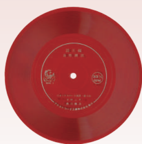
詩朗読(自作朗読)ソノシート 草野心平「たまごたちの風景」「富士山」収録 1968年4月 角川書店