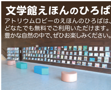
文学館えほんのひろば アトリウムロビーのえほんのひろばは、 どなたでも無料でご利用いただけます。 豊かな自然の中で、ぜひお楽しみください。

朗読サロン 11月13日(土)、12月11日(土) いずれも11時～12時 文学館小講堂 楽しみながら朗読を学びます。お気軽にご参加下さい。 文学館ボランティアの会事業 参加無料