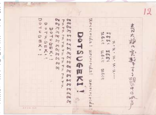
草野心平自筆原稿「青大将に突撃する頭の中の喚声」 『第百階級』(1928年11月 銅鑼社) 所収