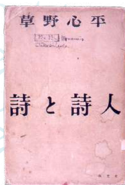
草野心平『詩と詩人』 1954年6月 和光社

「殊更に擬音を使おうと思つたことは一度もない」、「音も持たない対象からも擬音が生れる程、それは心象の音性的表現なのである」と語つた心平の作品の中から、オノマトペを用いた詩篇を紹介しします。