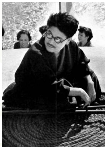
草野心平 十和田湖上にて 1951年

草野心平は、富士山、蛙などの動植物、天などを主題として、生涯で約一四〇〇篇の詩を作りましたが、特徴的なオノマトペ（擬音語）を作品に用いたことでも知られています。